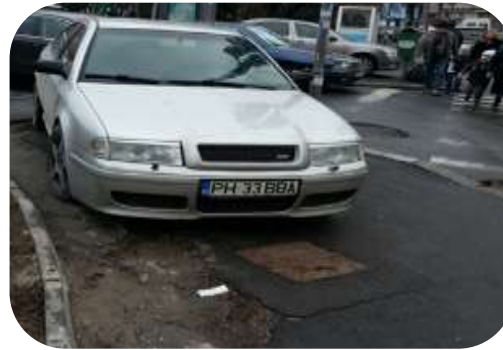
Politică de parcare