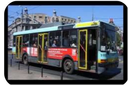
Rezolvarea lipsei de întreținere corespunzătoare