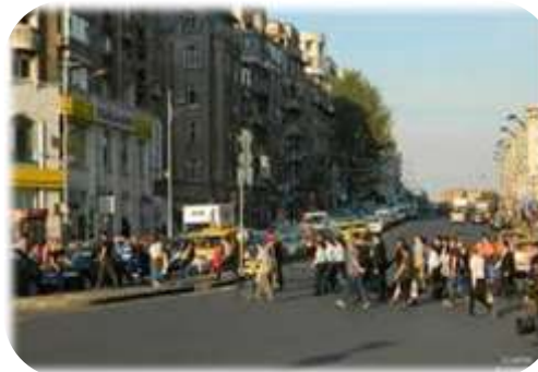
Transportul nemotorizat - pietonal și cu bicicleta